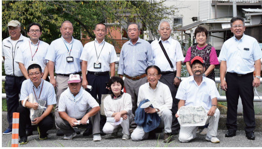
写真は参加者の皆さん