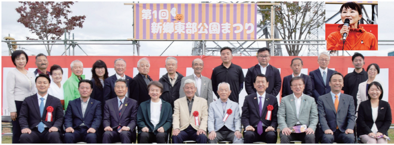
新郷東部公園祭り