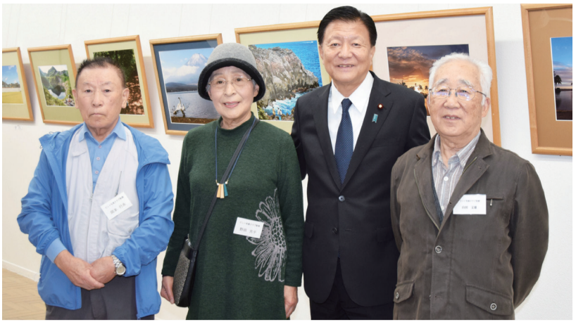
写真展の前で記念写真。

ブ新郷(会長)は、11月6日から12日まで、川口市立新郷小学校の事業に協力し、写真展を開催した。担当大臣も鑑賞された。色や構図、人物の表情、背景や風景など、どれも素晴らしく、28年と続いた。親睦を大切にする活動のしるしと、お越しいただき、ありがとうございました。